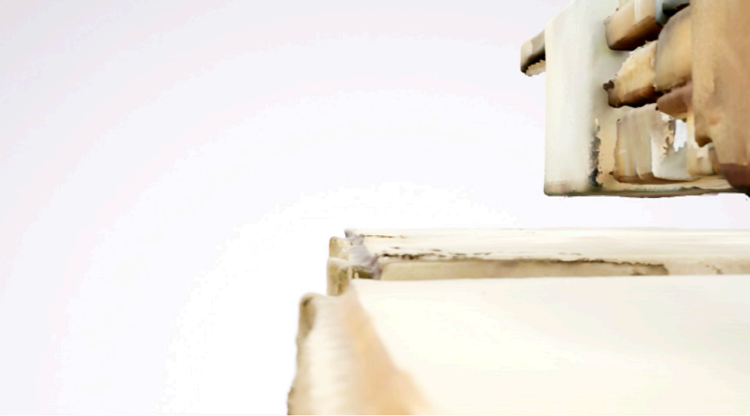
Chronicle Cloud, 2023