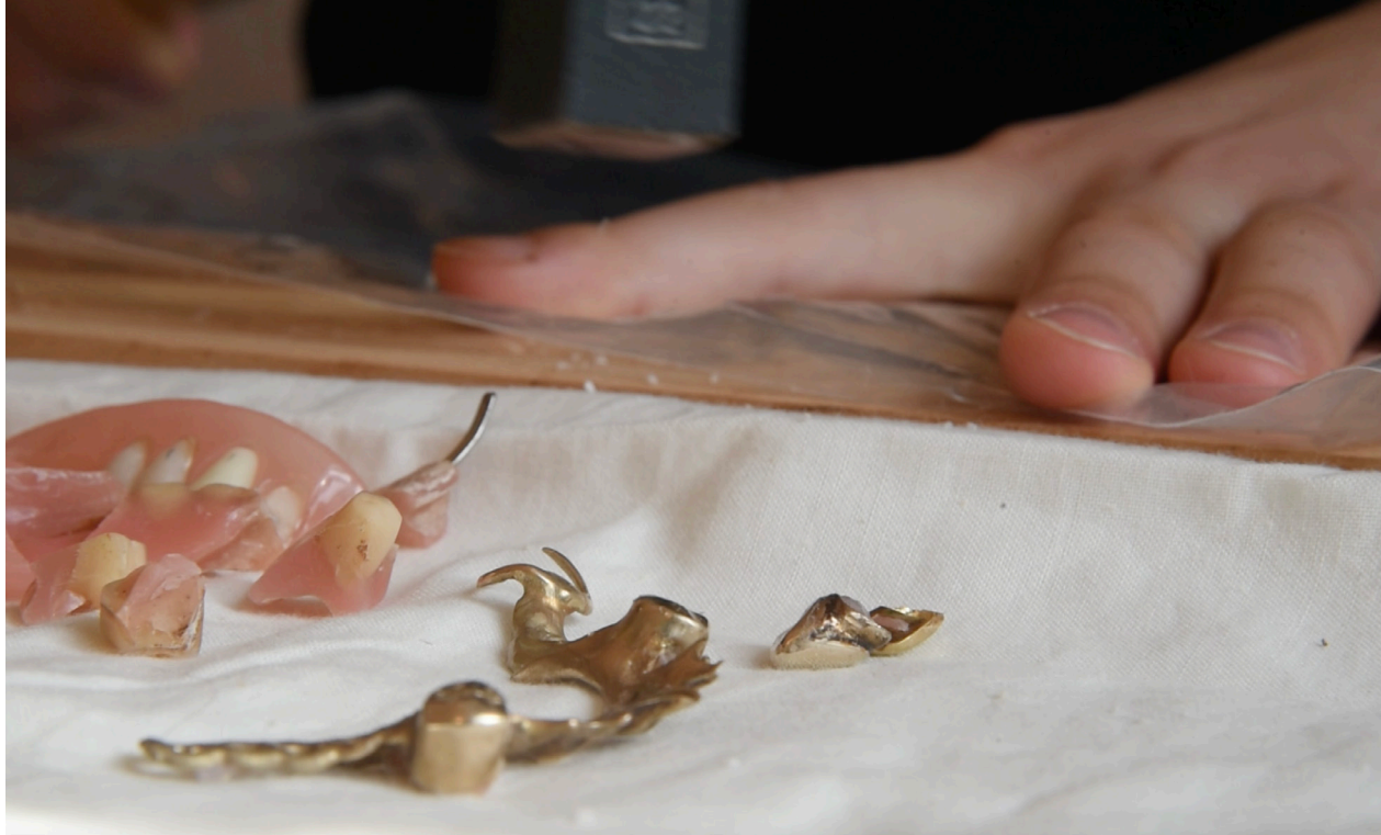
gut gekaut ist halb verdaut, 2024