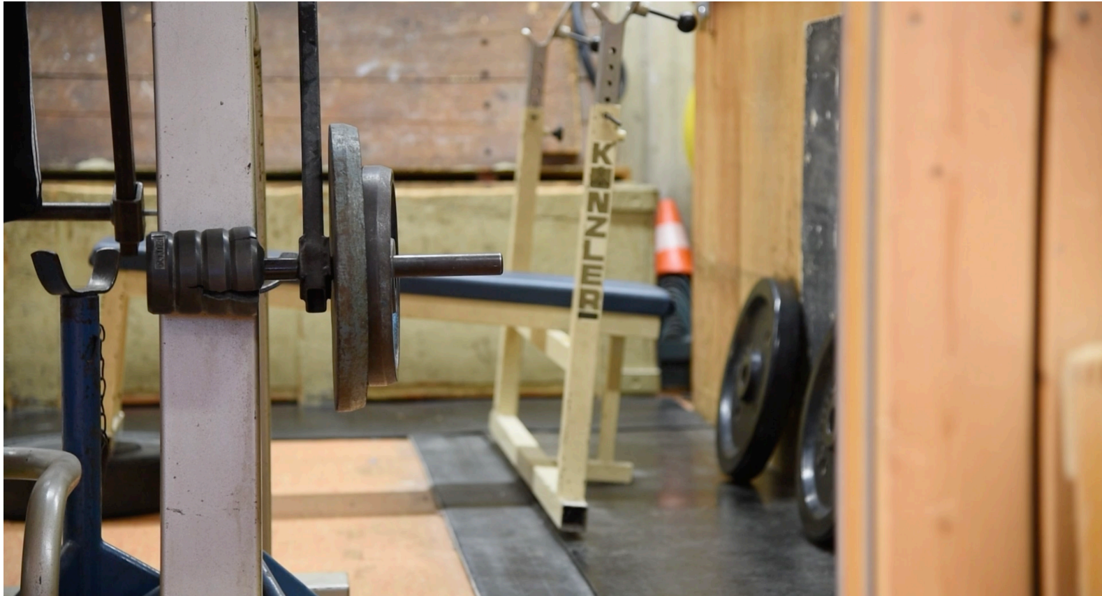
was uns trennt und was uns vereint, 2025